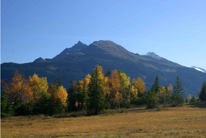
Fantastische(r) Einblick(e) in die Gipfelwelt der Hohen Tauern