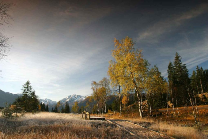
Moorerlebnis Wasenmoos am Pass Thurn