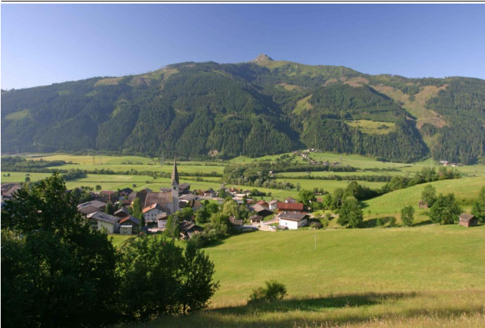
Blick auf die Gemeinde Stuhlfelden