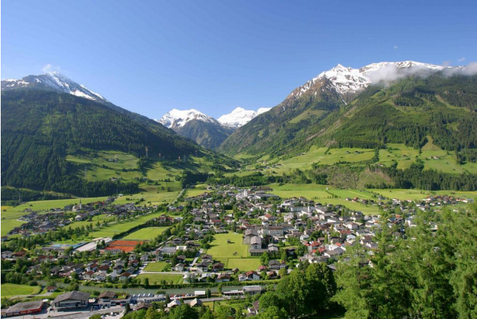
Der Felberberg (links im Bild)