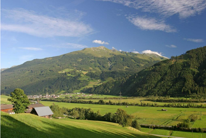
Blick über Hollersbach zum Lachwald