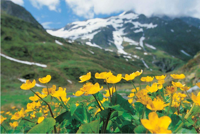
Sumpfdotterblumen im Hollersbachtal