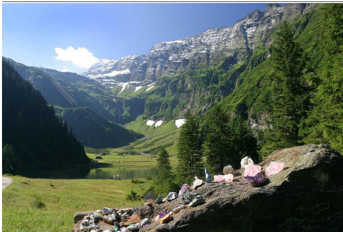
Blick auf den Hintersee und den Tauernkogel (hinten links)