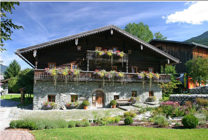
Das Klausnerhaus liegt direkt im Ortszentrum von Hollersbach.