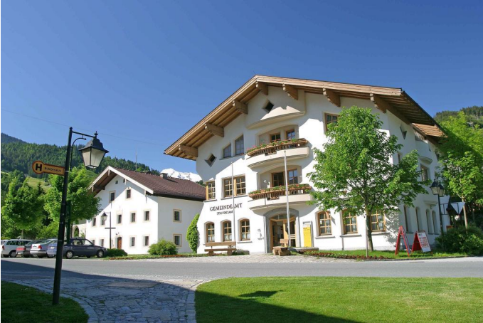
Das Gemeindeamt Hollersbach - der Startpunkt vieler Wandertouren